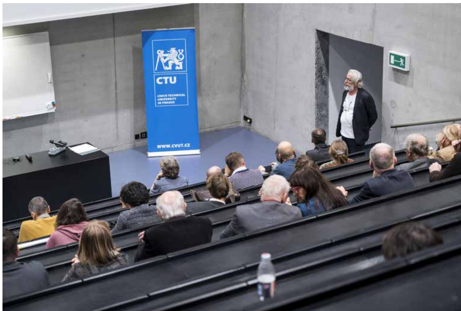
Představení kandidáta na děkana Fakulty architektury ČVUT v Praze (16.11. 2017)