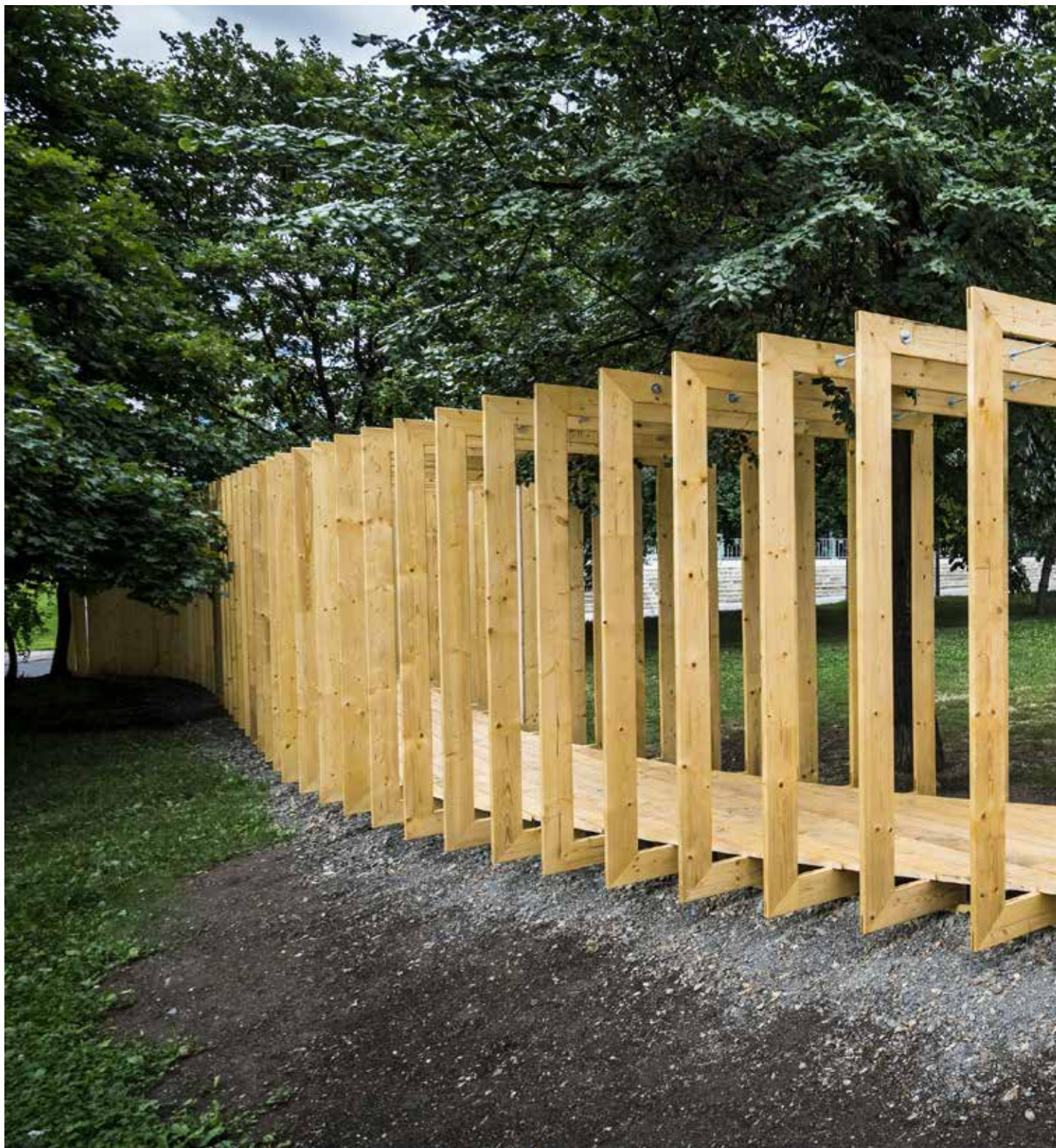
Vernisáž dřevěné instalace MáMA (18. 7. 2017)