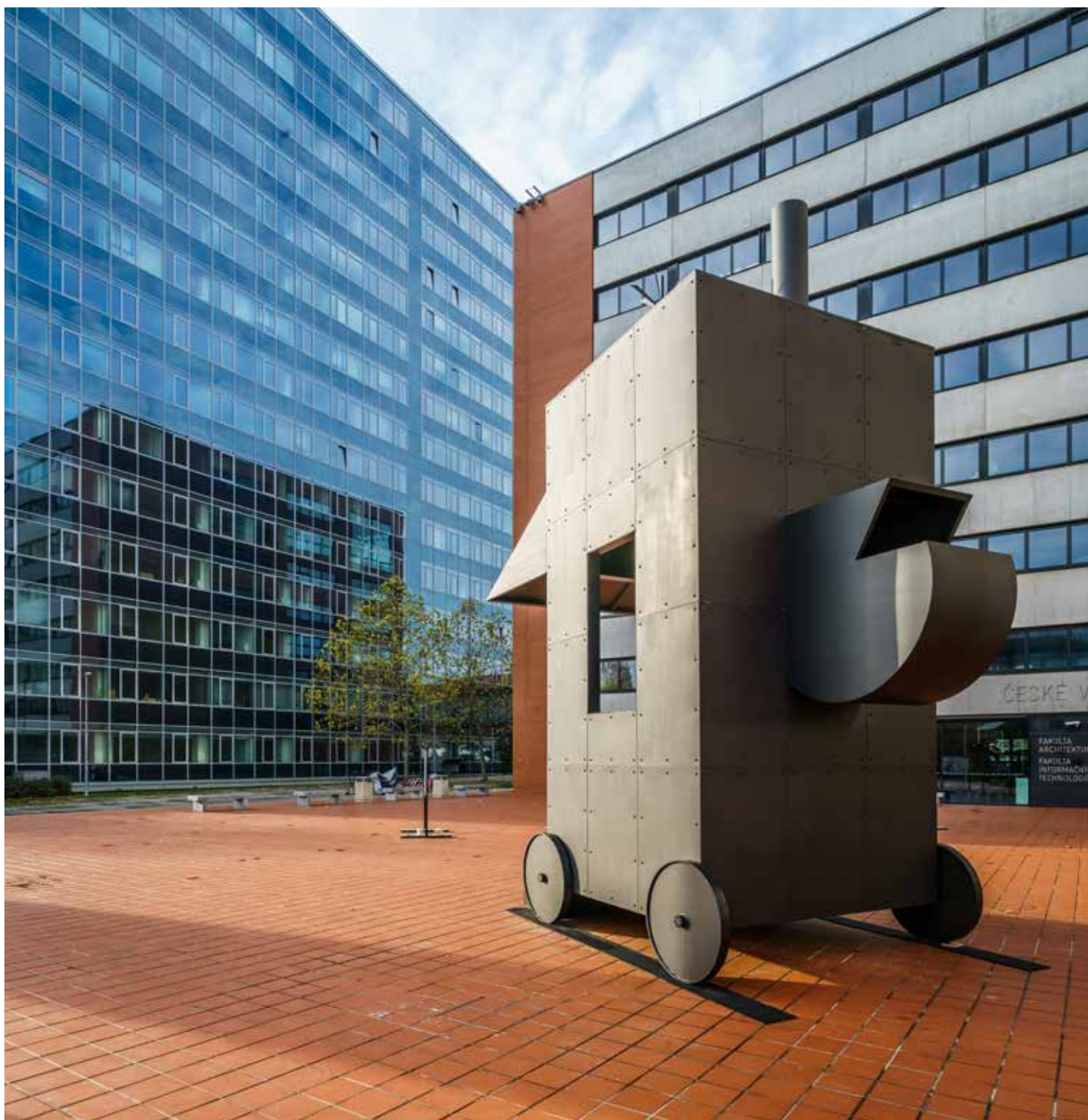
Rolling House, Piazzeta FA ČVUT, listopad 2019.