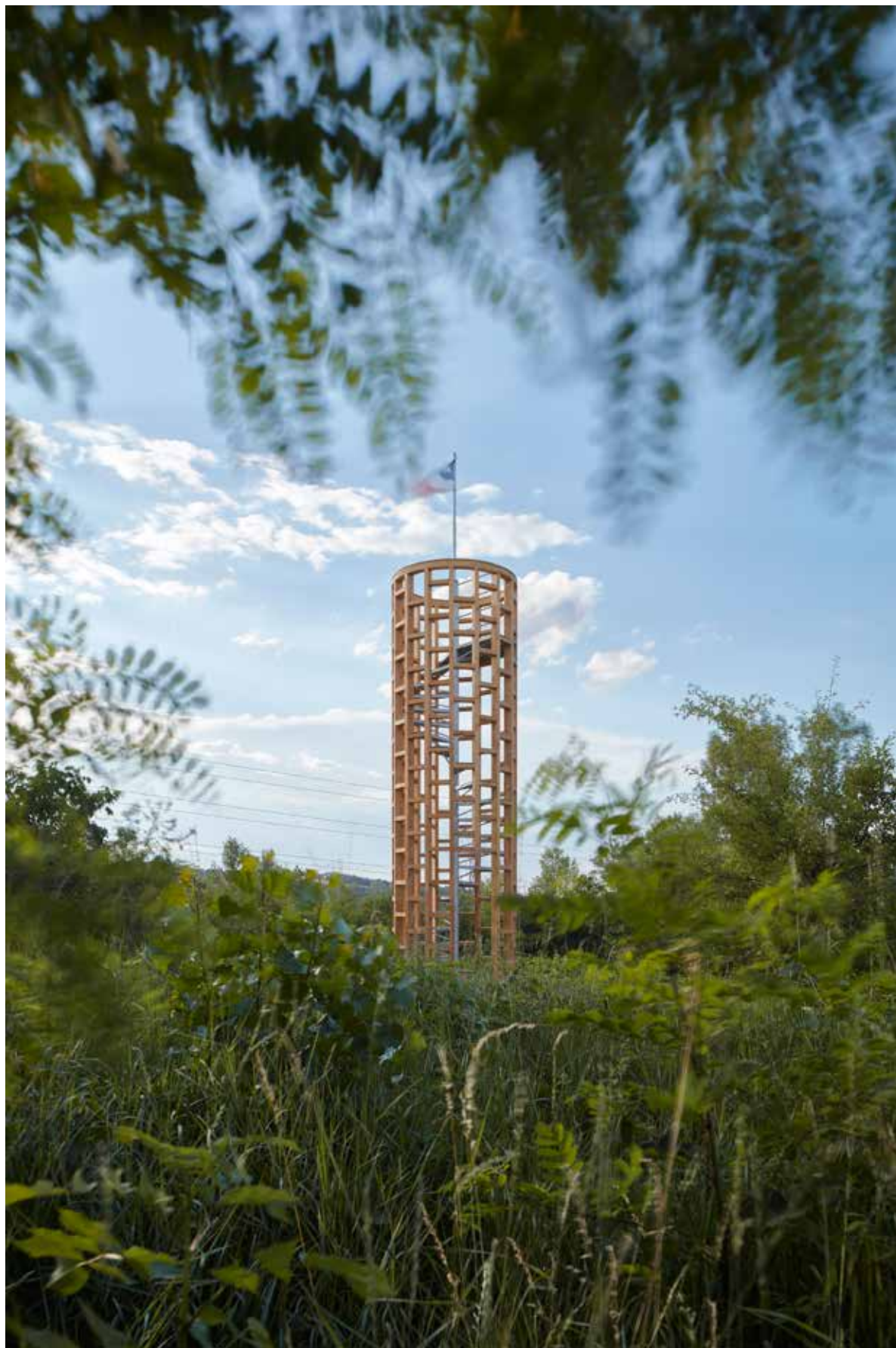
Stožár v Libčicích strana 100–101