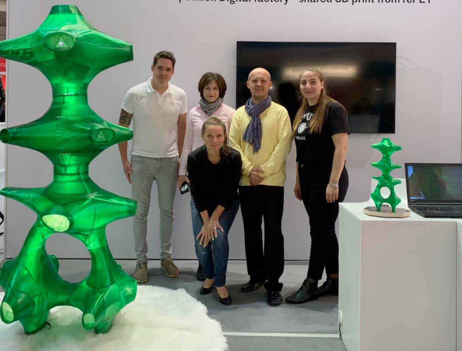
Kaleidoskop Petmat Strojírenský veletrh

Vítězný návrh studentské soutěže Digitální továrna – sdílený 3D tisk z recyklátu Winner of the student's competition Digital factory – shared 3D print from rePET