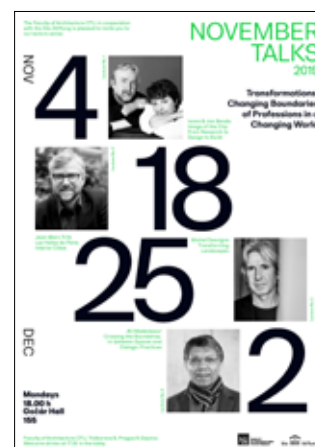
PLAKÁT November Talks 2019

Ústav teorie a dějin architektury spolu s Ústavem památkové péče pořádal ve dnech 25. – 28. září 2019 mezinárodní workshop v rámci aktivit EAAE Thematic Network on Conservation (mezinárodní evropské sítě architektů působících v oblasti památkové péče o architektonického kulturního dědictví) s názvem EAAE Conservation / Demolition Workshop VII. Účastníci na něm diskutovali