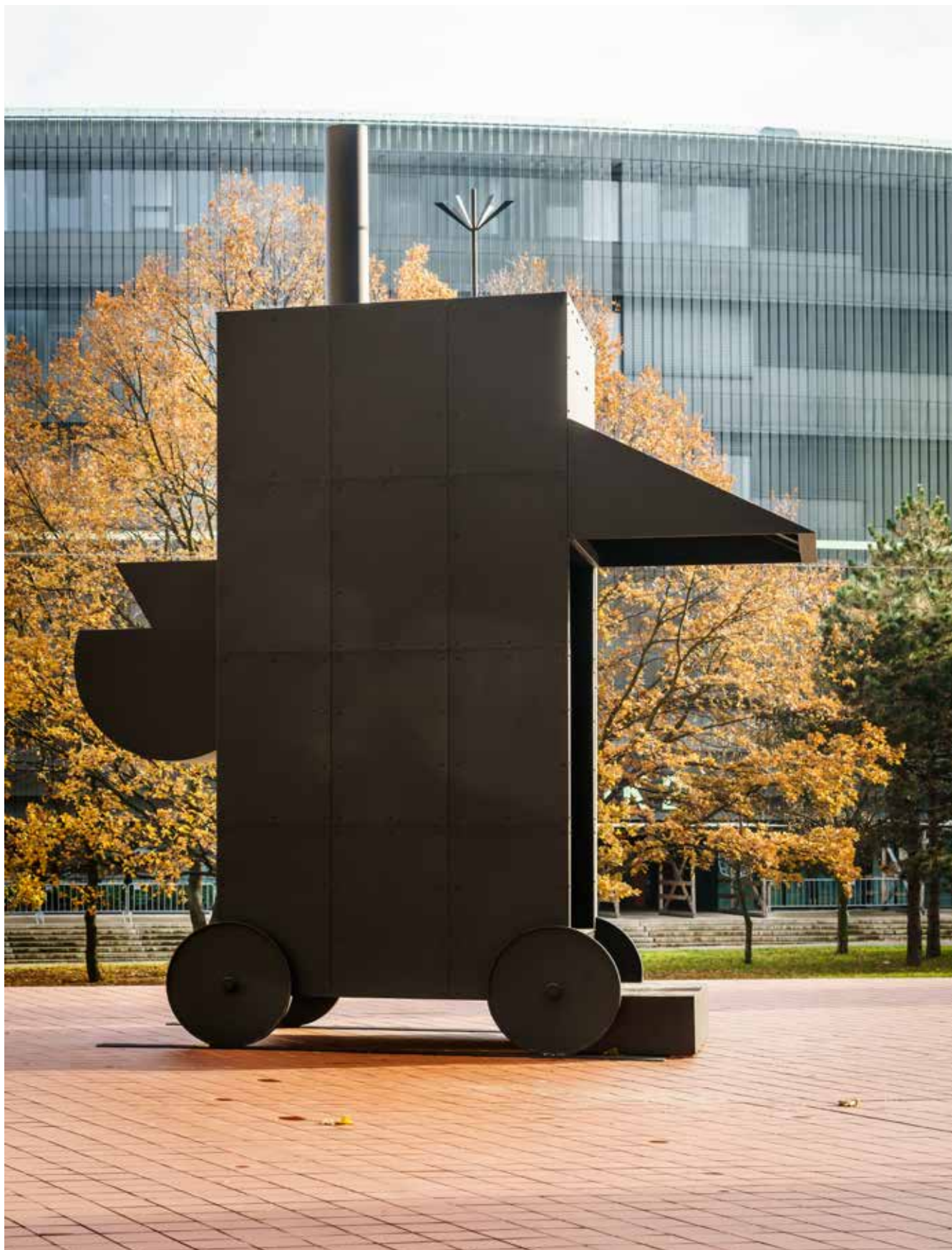
Rolling House, Piazzeta FA ČVUT, listopad 2019.