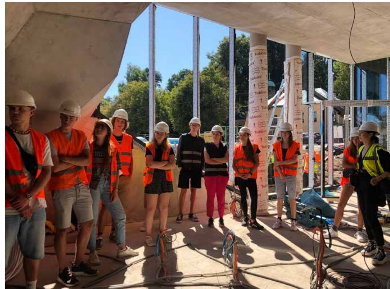
Seznamovací kurzy pro prváky.