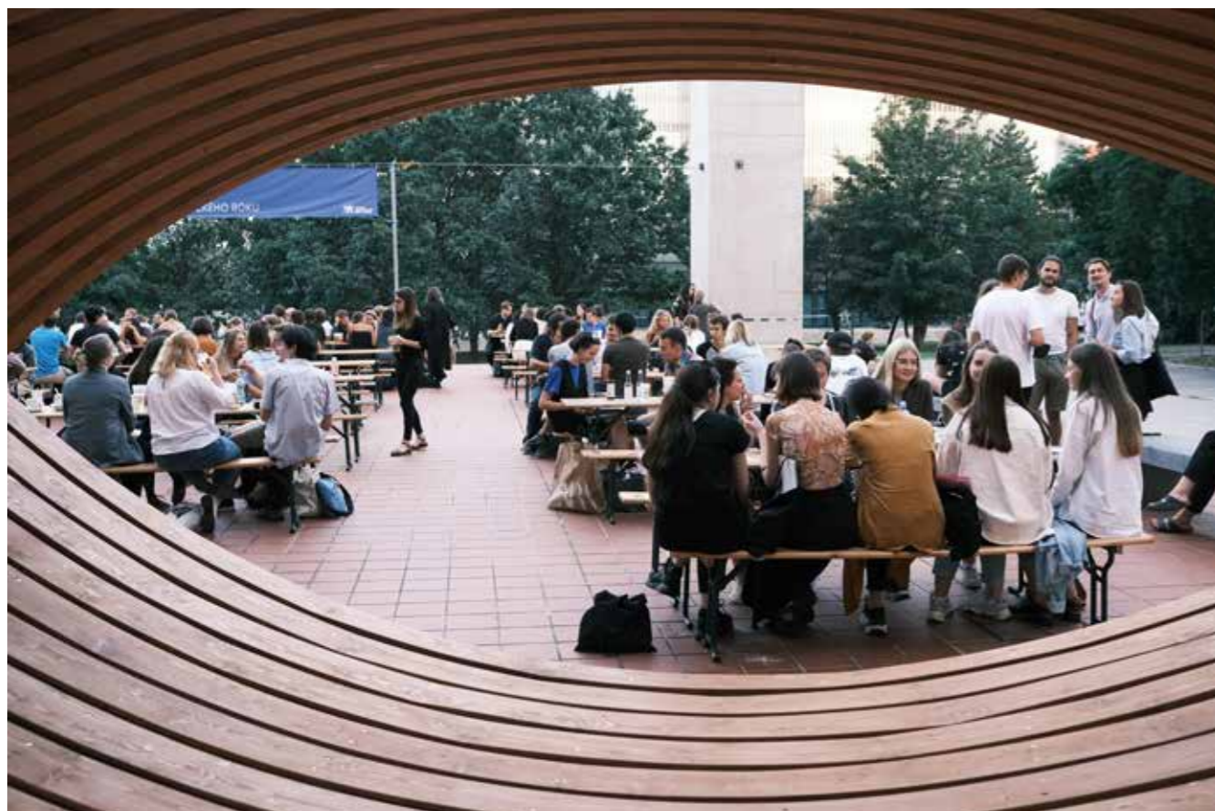
FA restart – zahájení akademického roku.