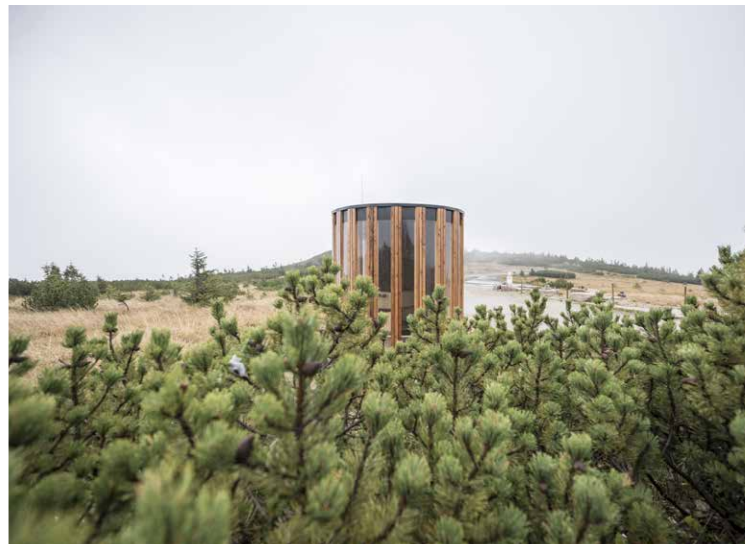
Piškot v Krkonoších.

a magisterských studijních programů. Odborníci z praxe mají rovněž výrazné zastoupení v porotách studentských soutěží, například v soutěži Olověný Dušan pořádané Spolkem posluchačů architektury (SPA) nebo v mezinárodní Studentské soutěži o nejlepší urbanistický projekt pořádané FA ČVUT a v soutěžích, které jsou pořádané jinými institucemi, např. Bienále, Expo, Designblok, Talent designu.