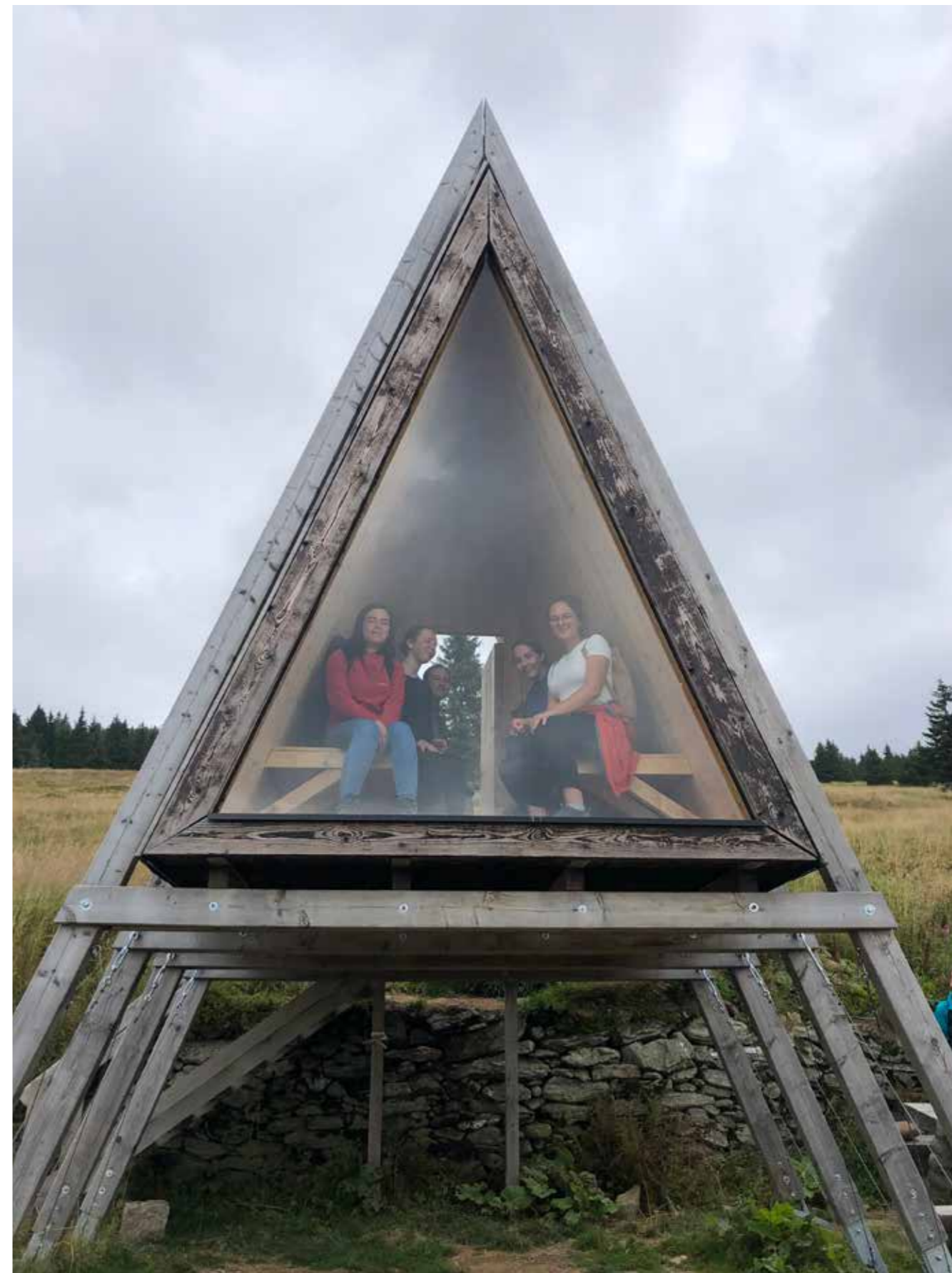
Seznamovací kurzy pro prváky.