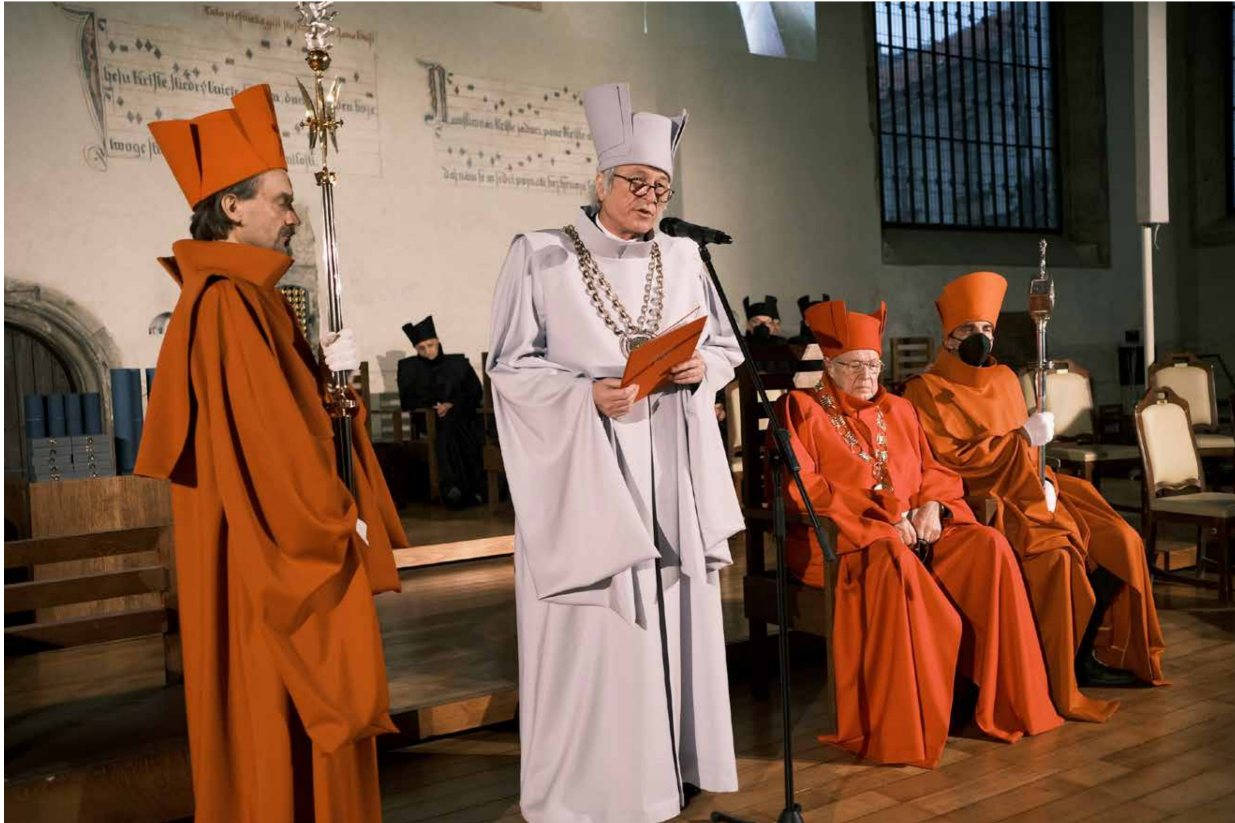
Oslavy 45 let FA.