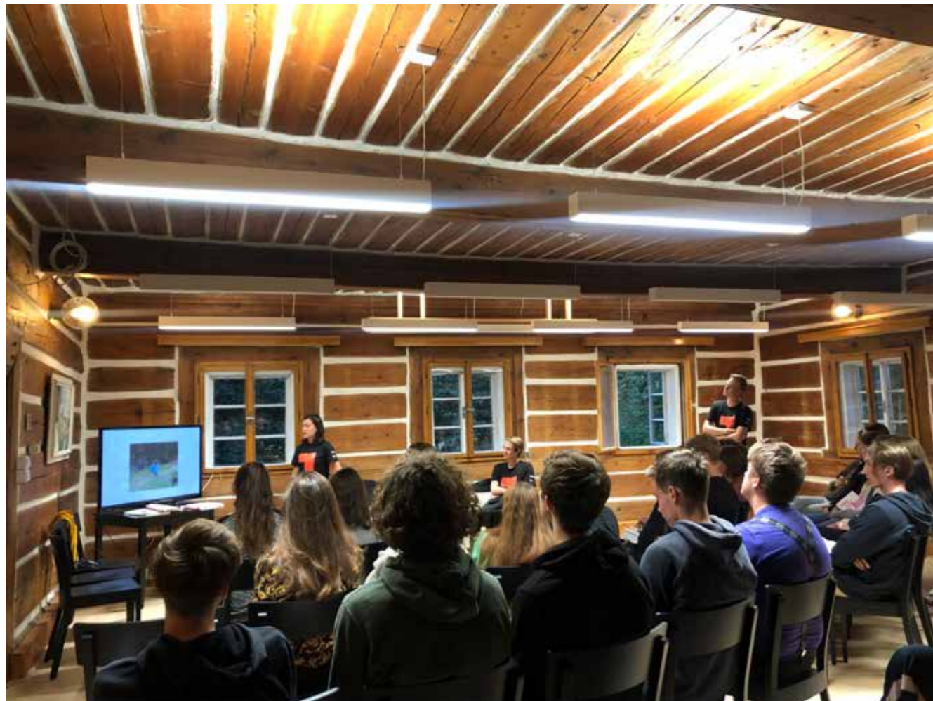
Seznamovací kurzy pro prváky.