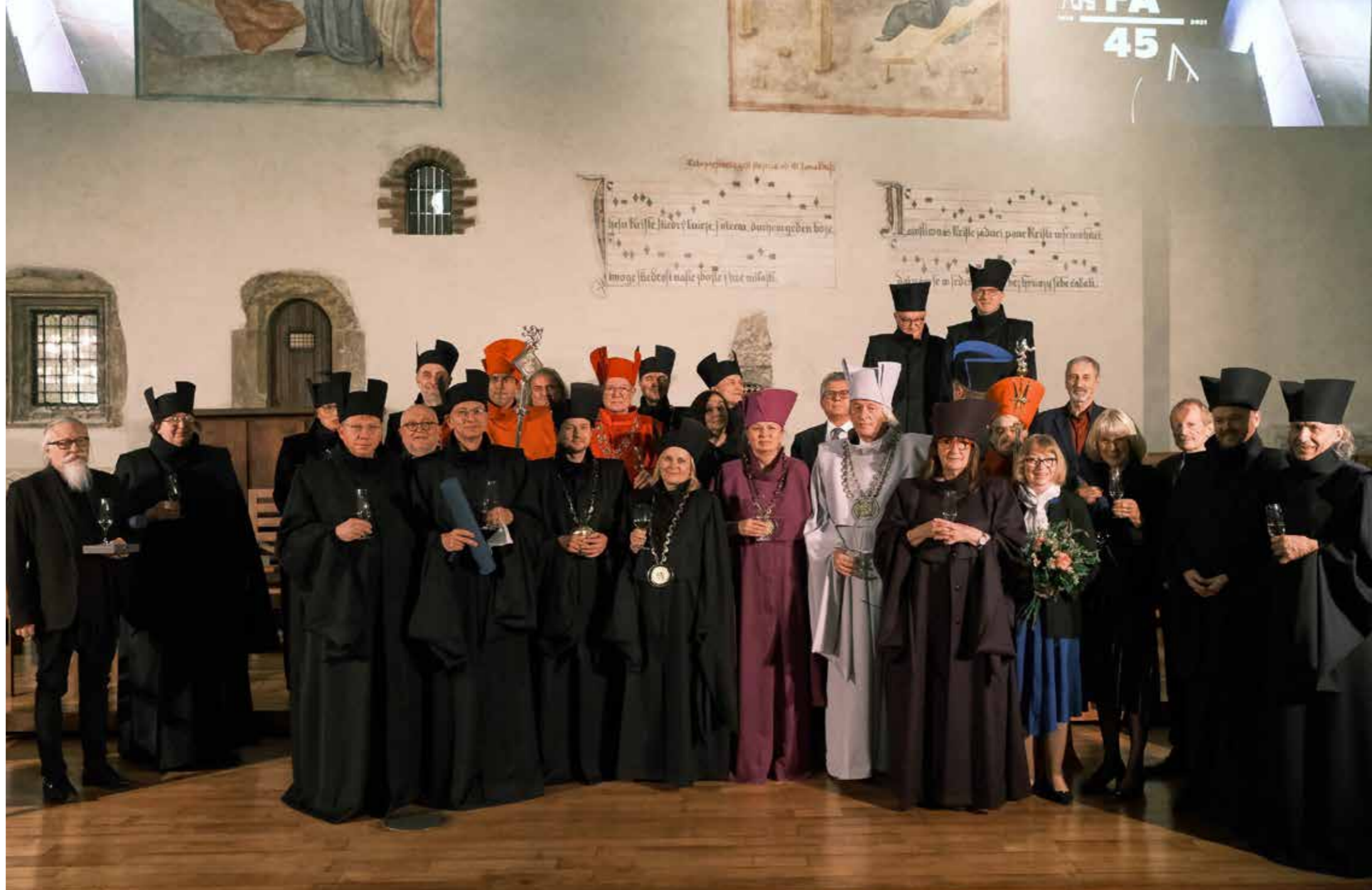
45 let FA v Betlémské kapli