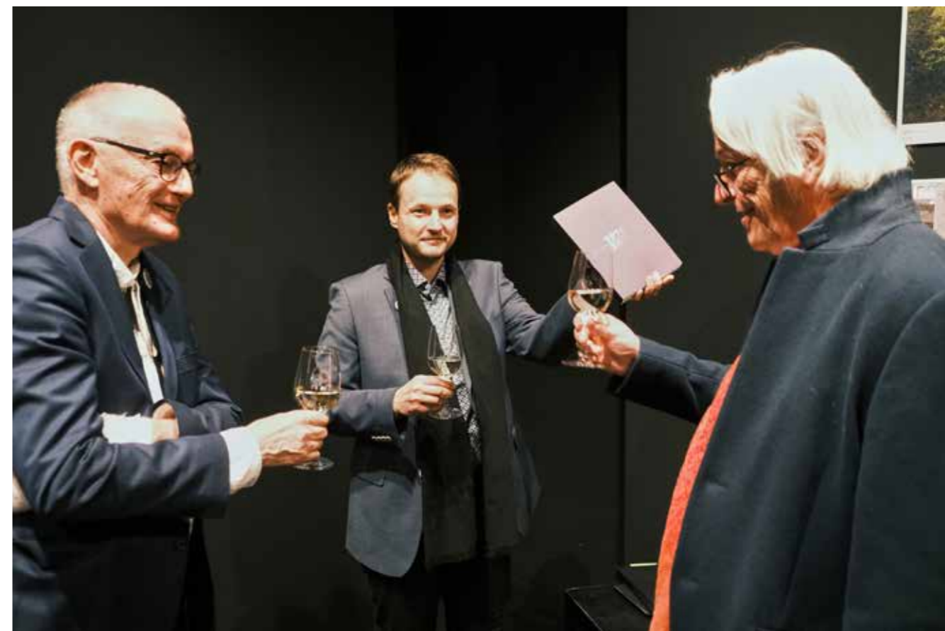
Křest knihy FA 45 v Galerii Jaroslava Fragnera.