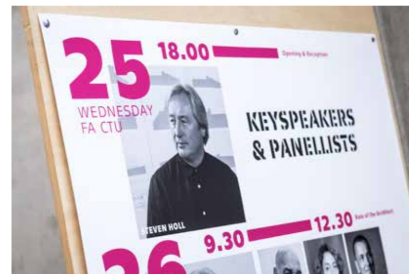
Plakát Konference EAAE.

Stejně jako každý rok vyšla i tentokrát na konci akademického roku Ročenka Fakulty architektury Českého vysokého učení technického v Praze 2020/2021. Jedná se o reprezentativní publikaci, jež zachycuje dění na fakultě, jednotlivých proděkanátech i ústavech a prezentuje zadání i nejzajímavější studentské projekty všech školních ateliérů.