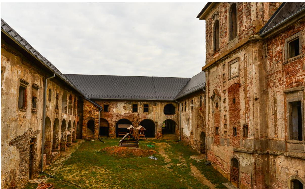
Vnútorň dvor kaštieľa a jeho atmosféra https://slovaktraveler.sk/zelezna-cesta-slava-a-pad-rodu-coburgovcov-cast-1-kastiel-v-jelsave/