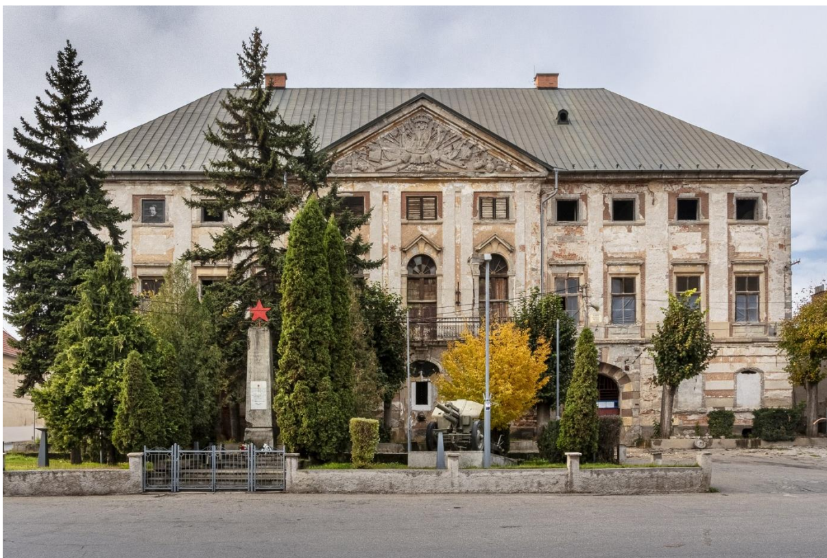
S uličného pohľadu je vidno neoklasicistické priečelie kaštieľa https://ciernediery.sk/