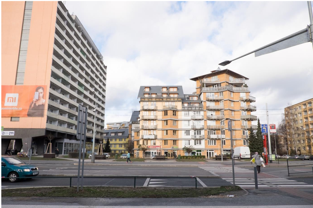
situace "Petřinského náměstí"

i stanice metra). Na severu zástavba ustupuje od uliční čáry, vytváří tedy rozsáhlejší prostranství vhodné pro náměstí. I přes vlastní odpor zde Milunić tento ústup uliční čáry dodrží a myšlenku náměstí podpoří. Dokonce i tím, že zde vytváří funkční parter. Před kterým je však bohužel umístěno jedno ze soukromých parkovišť, které jakýkoliv potenciál vzniku živého funkčního náměstí popírá.