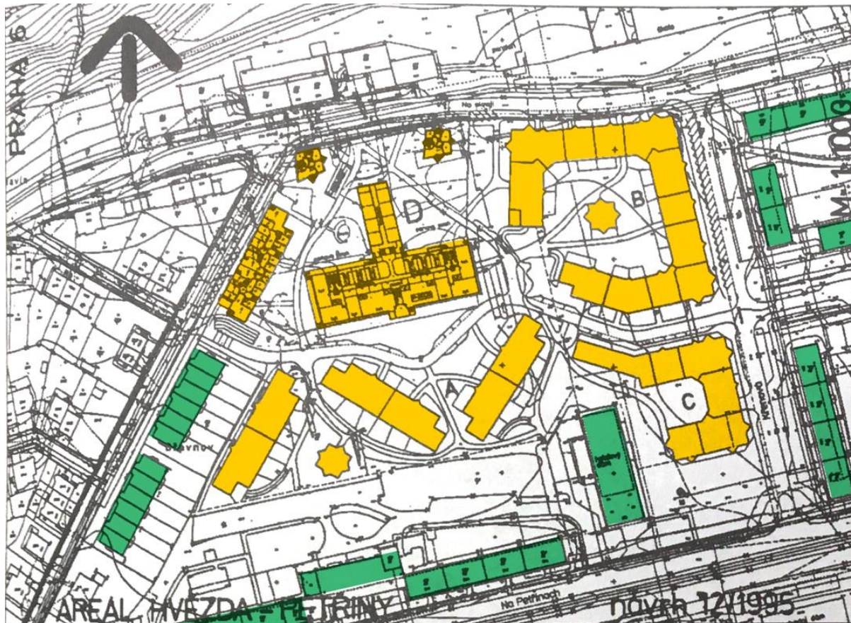
situace návrhu areálu Hvězda od Vlada Miluniče – finální návrh (s označením jednotlivých budov - žluté A-E) archiv Vlada Miluniče

Tento přístup je jistě chvályhodný, ale je kontextuální? Kontext místa se tedy spíše, než do urbanistického řešení umístění jednotlivých hmot, Milunič snaží vtisknout hmotám samotným. Ty, jak již bylo popsáno mají snahu svými měřítky vytvářet jakýsi gradient mezi vesnickým měřítkem a tím sídlištním. Měřítko některých bloků tento princip však opouští a vytváří až příliš velké celky. Řešení samotných domů vychází, dle slov architekta, z geometrie nedalekého letohrádku Hvězda a z typologie obranných věží typických pro ostrov Hvar. Dá se tedy vůbec mluvit o řešení kontextu? Nejedná se opět jen o následné nastavování argumentů pro vysvětlení architektury, která vzniká z jiných podnětů?