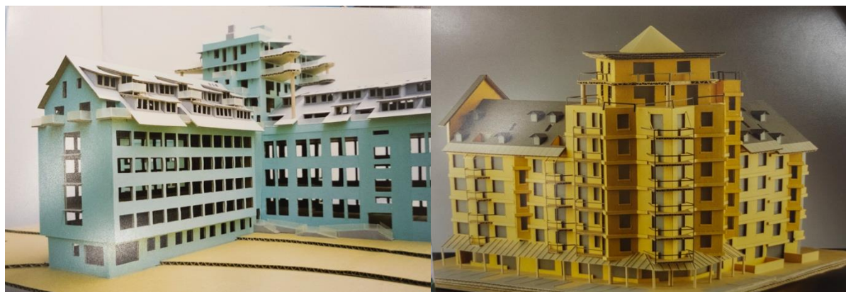
finální modely objektů D a C archiv Vlada Miluniće

Skutečně jsem nebyl schopný nalézt mnoho takových příkladů. Místo nich jsem našel příklady různých podivných 'architektur pro architektury' jako různé římsy a podobné detaily, které jen „zachraňují“ situaci vzniklou jiným, problémovým principem/detailem.