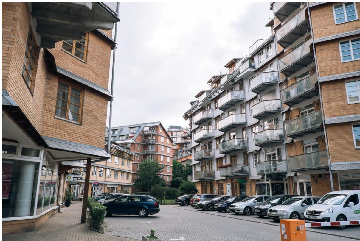
východní vjezd do areálu

Dalším prostředkem, kterým Milunič nastoluje příjemnou atmosféru areálu je naprostá absence možnosti vjezdu motorových vozidel do hloubky areálu. Podél okolních cest se nachází vjezdy do společných podzemních garáží a dvojice příležitostných nadzemních krátkodobých parkovacích stání.