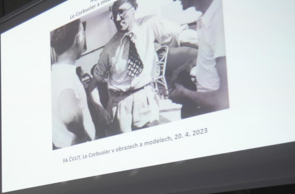
FA ČVUT, Le Corbusier v obrazech a modelech, 20. 4. 2023