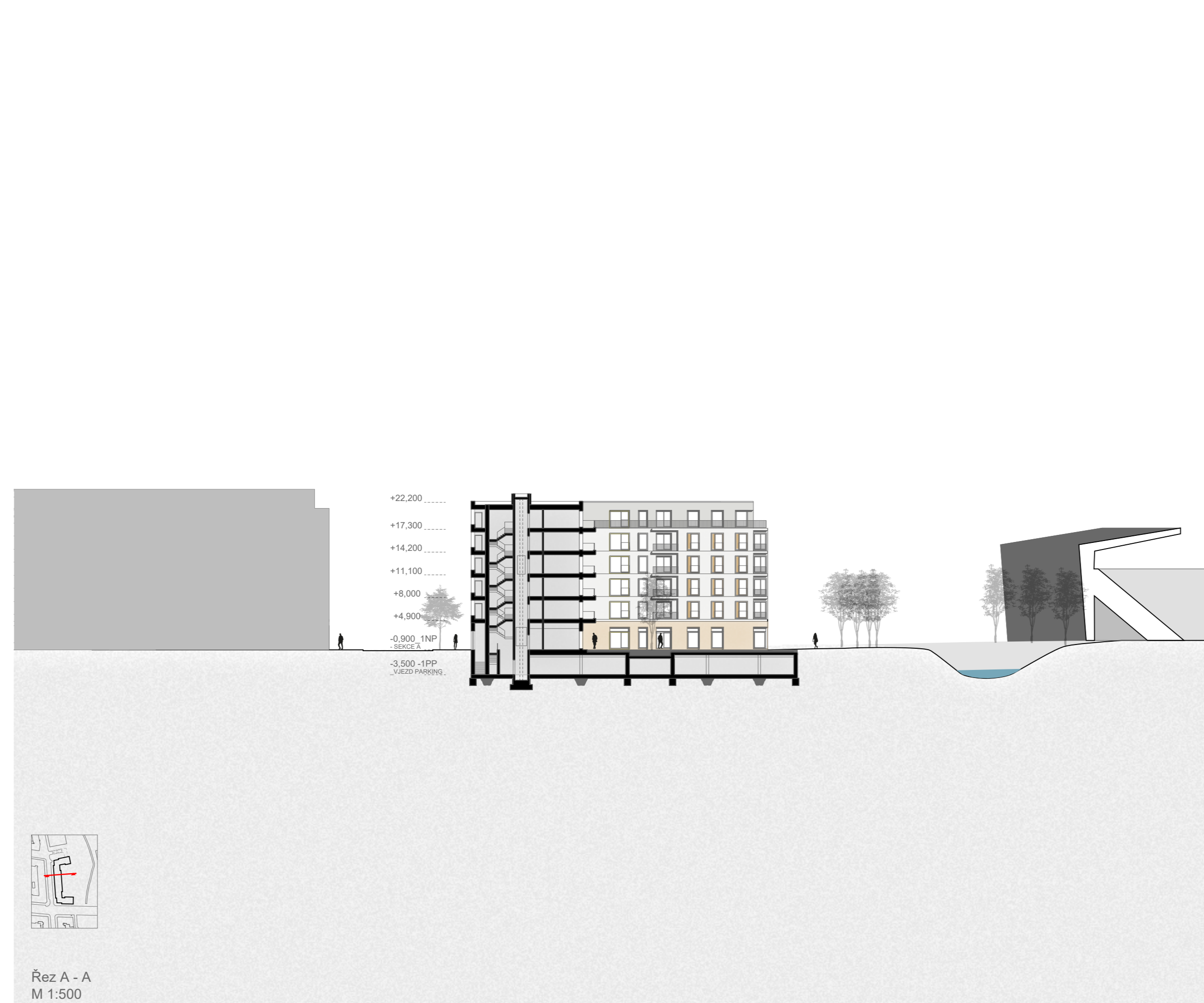
Řez A - A M 1:500