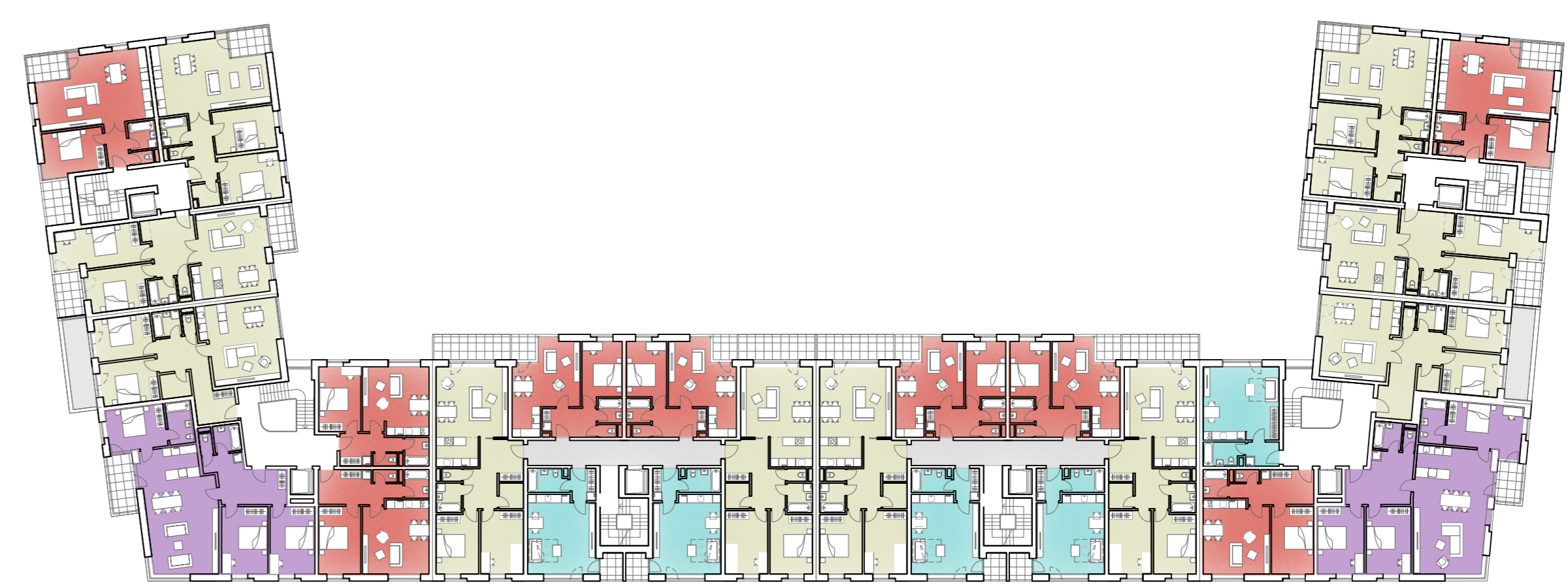
č) Půdorys typického podlaží M 1:350