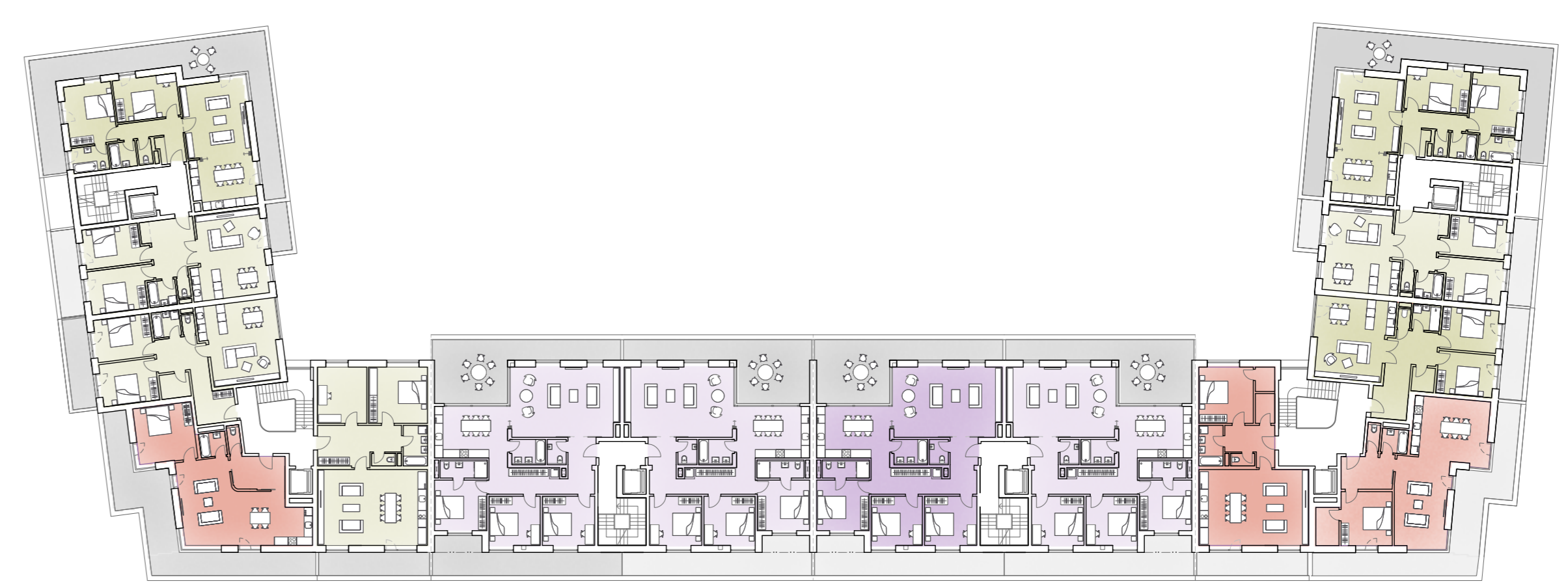
č) Půdorys 8. no. - střední podlaží M 1:350