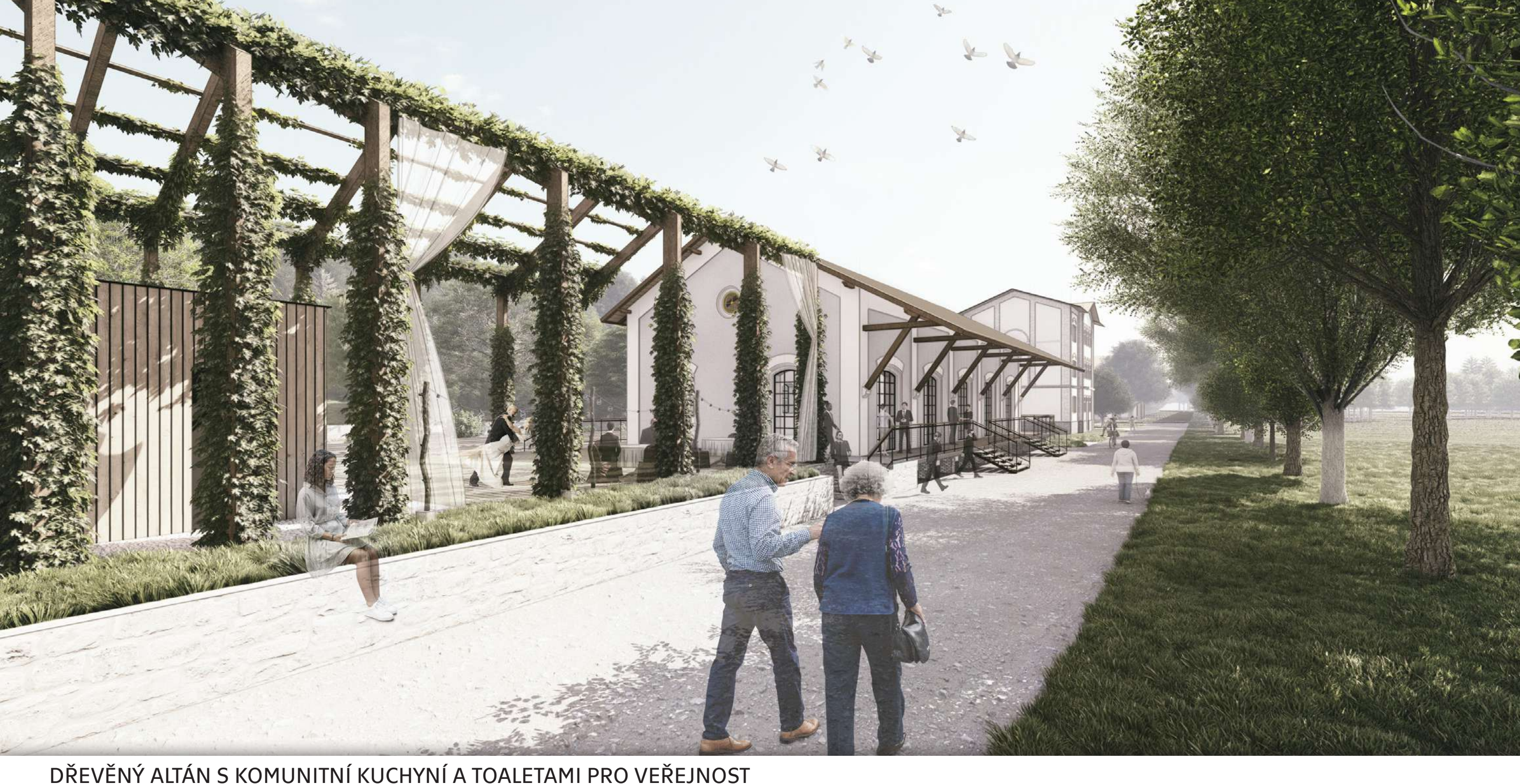
DŘEVĚNÝ ALTÁN S KOMUNITNÍ KUCHYŇÍ A TOALETAMI PRO VEŘEJNOST