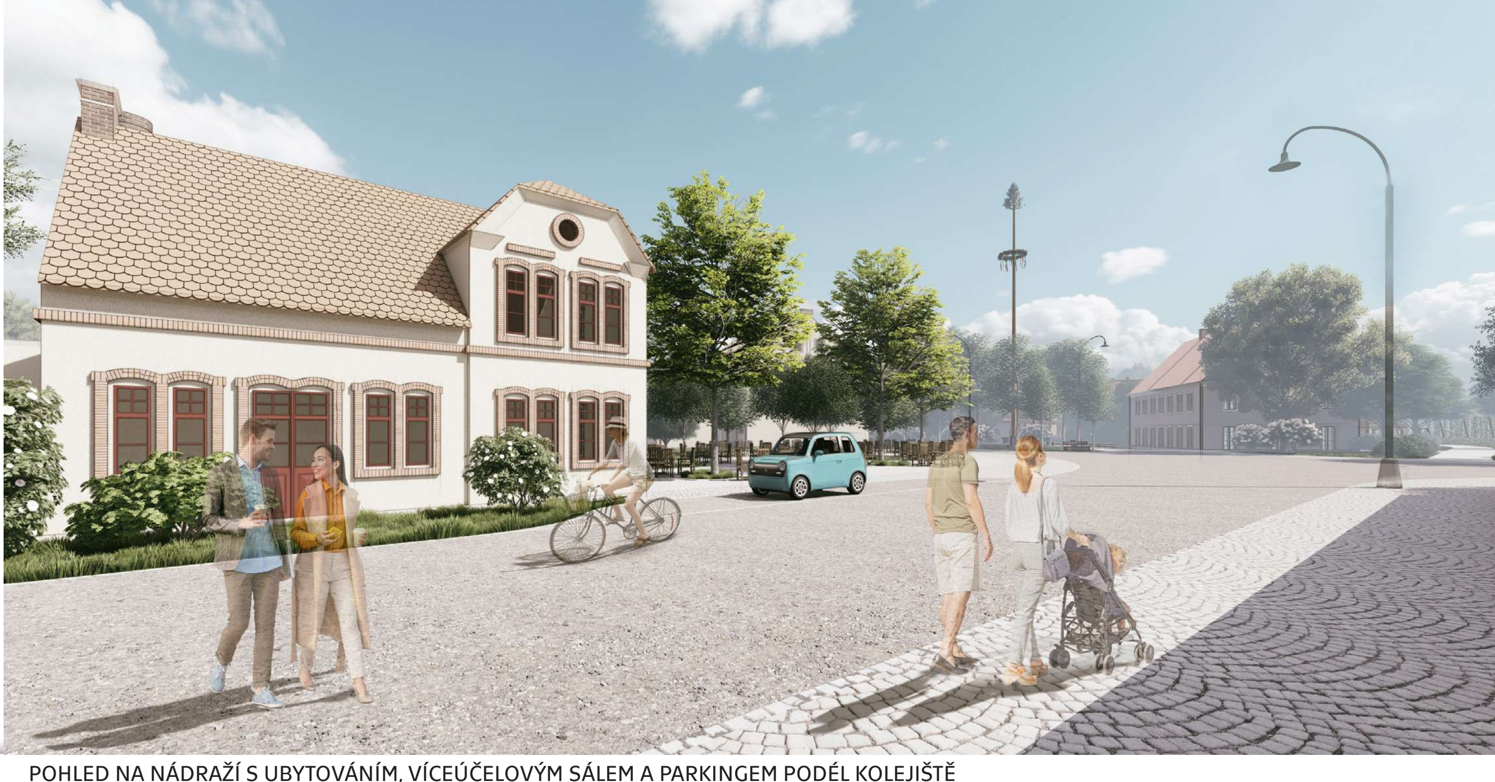
POHLED NA NÁDRAŽÍ S UBYTOVÁNÍM, VÍCECĚLOVÝM SÁLEM A PARKINGEM PODĚLE KOLEJISŤ