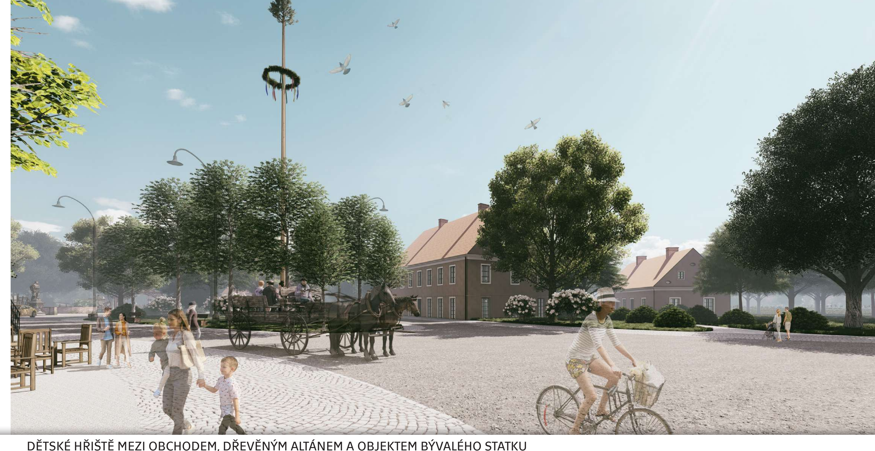
DETSKÉ HRISTĚ MEZI OBCHODEM, DŘEVĚNÝM ALTÁNEM A OBJEKTEM BYVALÉHO STATKU