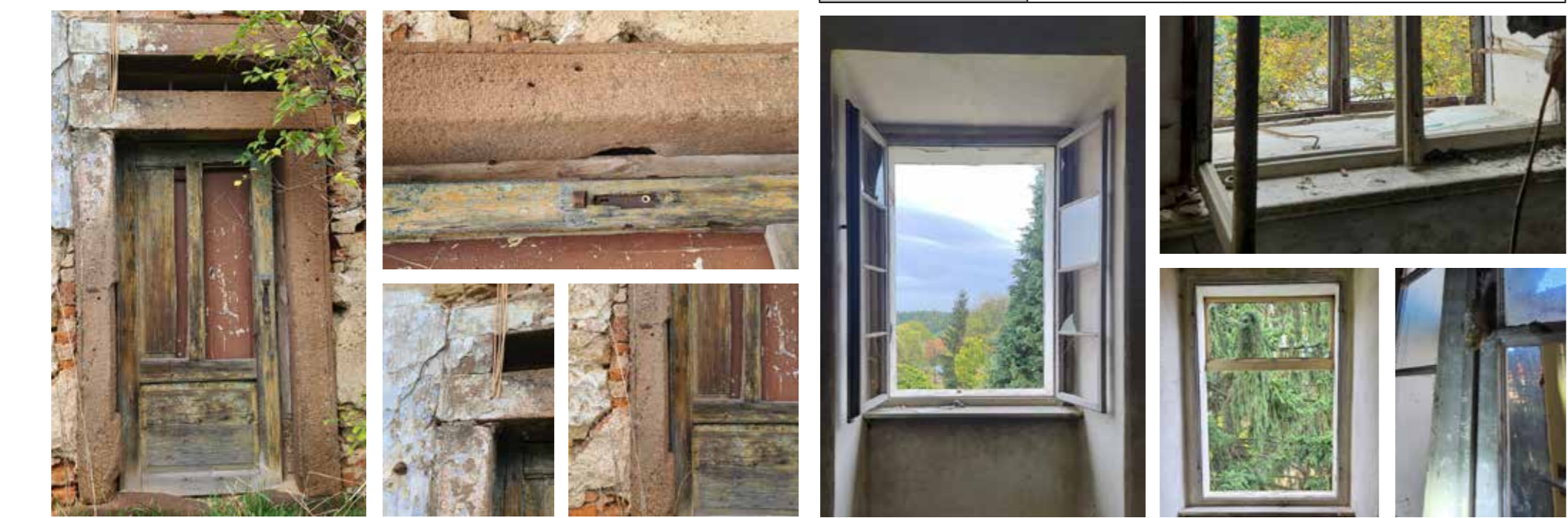
FOTOGRAFIE SOUČASNÉHO STAVU EXTERIÉR