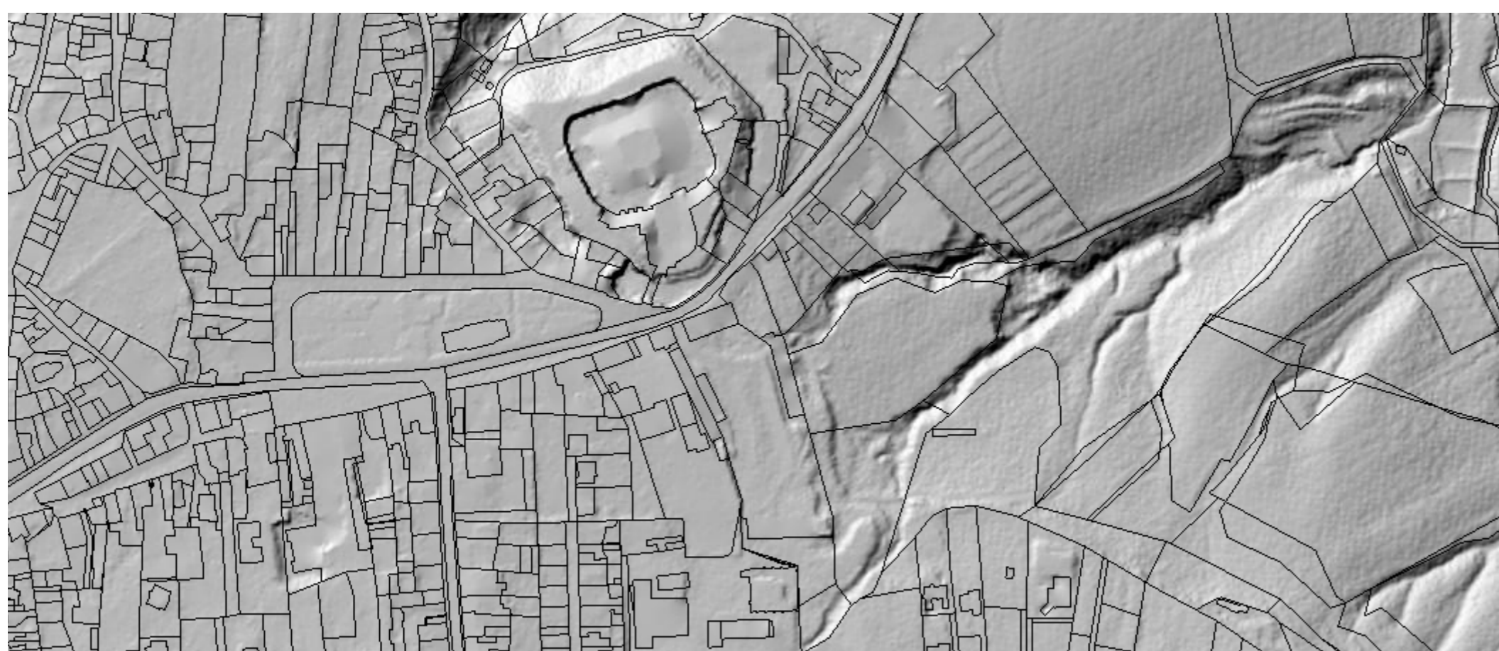
KOSTELEČ NAD ČERNÝMI LESY MORFOLOGIE TERÉNU

Na mapě panství z roku 1812 vidíme rozložení panství do dnešních rozměrů s novou vystavěnou stodolou v nejnižší části areálu. Do ulice se nachází objekt čp. 15. Na východní straně panství stojí ovlivněná a opěrné pilíře už jsou přistavěny a zakresleny. Na jižní straně naproti objektu čp. 15 je stodola, která má mírně odlišné proporce než na mapě panství z roku 1777. Stejně tak posledním objektem v areálu vedle stodoly je výrazně proláhlá. Přibýly zde vodní toky i nádrže (rybníky) z míst, kde se nacházejí původní studny. Die Urbälte z roku 1677 spadají do správy panství další objekty. Na východní straně areálu naproti chlívům je maštal pro kozy. Maštal je průchozí na dvoreček na druhou stranu, kde se nachází vinopánská s kůlnou a směrem do ulice Jagerhouse nebo-li myslivna.