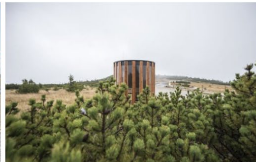
Ateliér Seho – Světlík