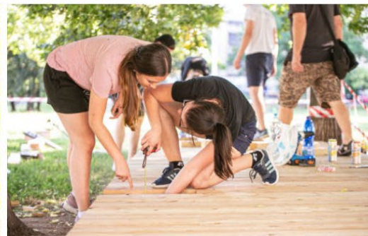
Ateliér Mádr – Tomš