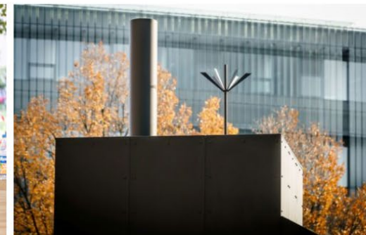
Ateliér Seho – Světlík