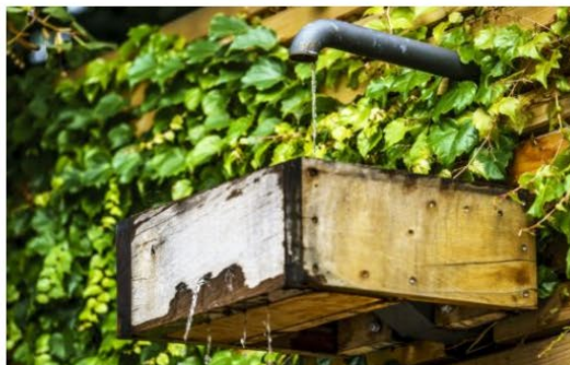
Ateliér Seho – Poláček