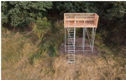
Ateliér Hlaváček – Čeněk