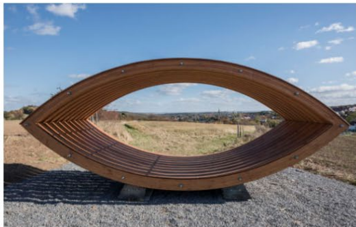
Ateliér Seho – Poláček