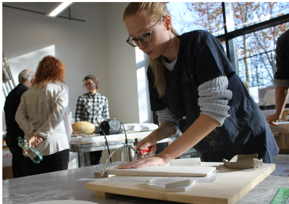
DOKUMENTACE POSTUPŮ U KONKRÉTNÍCH PROJEKTŮV PŘEDMĚ- TU ZD V ZS 2017