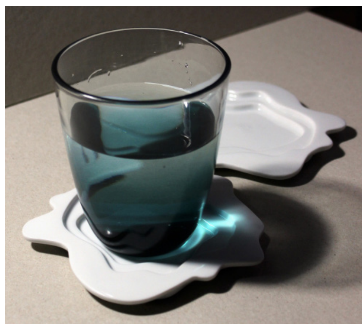
VÝSLEDNÉ PORCELÁNOVÉ PRODUKTY (TÁČEK POD...) REALIZOVANÉ STUDENTY 1. ROČ. V ZS 2017