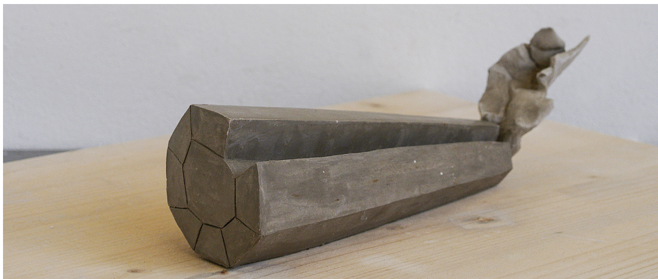
ZÁKLADY NAVRHOVÁNÍ, NÁVRH, KRESBA, MODEL, PŘÍRODNINA, STYLIZACE, KOMPOZIČNÍ ZÁKONITOSTI