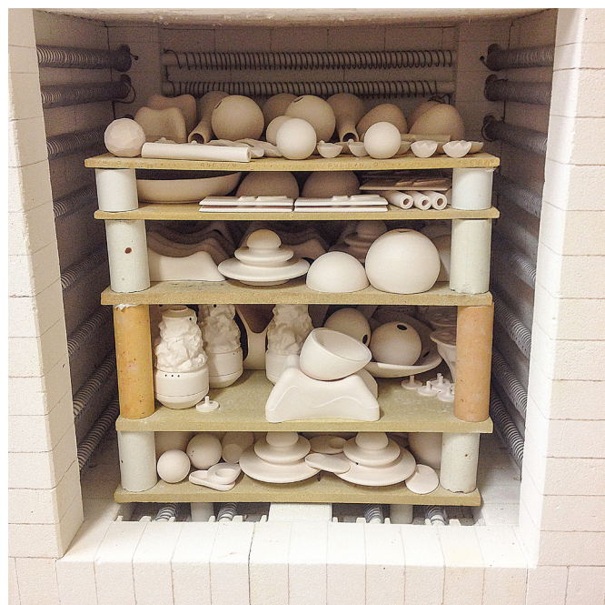
ZPŮSOB PRÁCE S PORCELÁNEM - LITÍ DO FOREM, MODELOVÁNÍ, VYTÁČENÍ, LISOVÁNÍ, 3D TISK, PÁLENÍ, GLAZOVÁNÍ