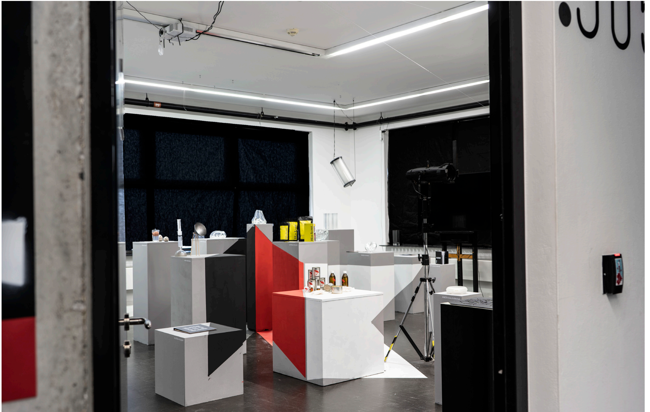
Klauzurní práce Ateliéru Karel