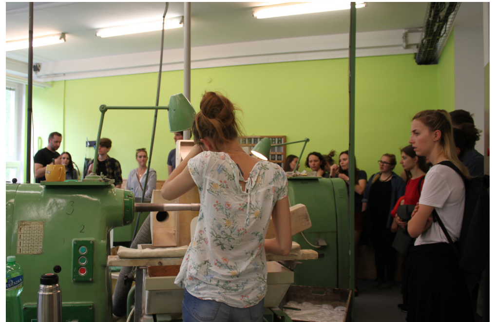
Exkurze: duben 2018